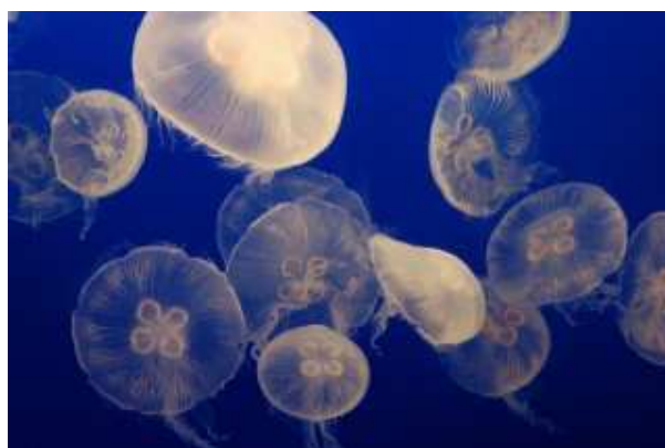
【イメージ画像=提供: 新江ノ島水族館】