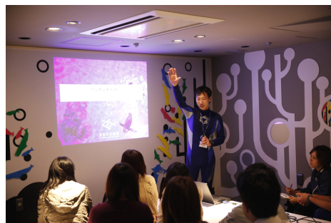
ペンギン解説プログラムの様子