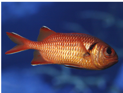
夜行性のアカマツカサ

『すみだ水族館』は、今後もアクアリウムファンに向けて新たな水族館の楽しみ方をご提案します。