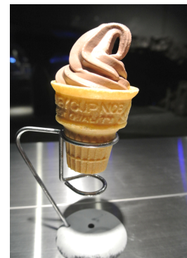
六三四くんソフト (税込63円)