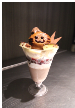
六三四くんデラックスパフェ (税込634円)