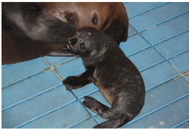
生後間もない頃の「六三四」

当日、「六三四」のゴハンはししゃもで出来た「特製ししゃもバースデーケーキ」に！また“さあゴハン(給餌)”の時には「六三四」の体重を測定します。1年前、生まれたての「六三四」は4,130gでした。この1年でどれくらいまで成長したのでしょうか。ぜひ皆さまで「六三四」の成長をご覧ください。