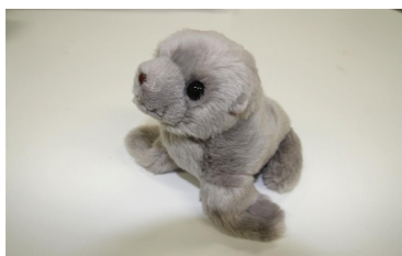
オットセイぬいぐるみ (税込634円 ※通常1,000円)

また、夏休み期間に12歳以下のお子さま向けに限定販売を行い好評だった「六三四くんソフト(63円)」がイベント期間のみ復活します。さらにスペシャルメニュー「六三四くんデラックスパフェ(634円)」を期間限定で販売します。かわいさ満点、味も折り紙付きの特別メニューをこの機会にぜひお召し上がりください。