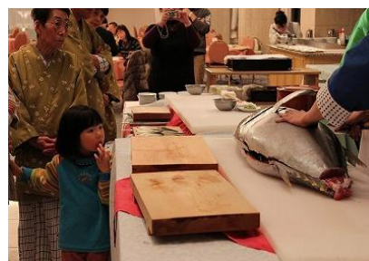
マグロの解体実演

マグロの解体実演/ フォアグラのセステーキ/ フカヒレ姿煮ラーメン/ オリックスグループ統括総料理長のローラン・ジャンマリー監修手作り スイーツ5種/ 信州安曇野産 食塩無添加トマトジュース/ 柏餅