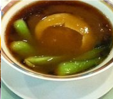
フカヒレ姿煮ラーメン