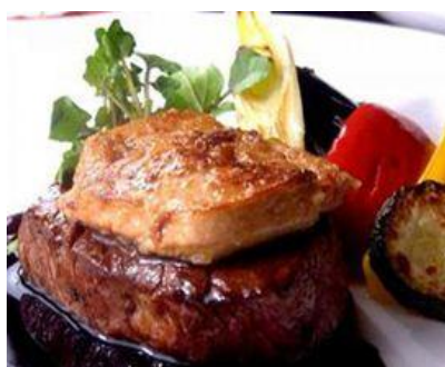
フォアグラのセステーキ