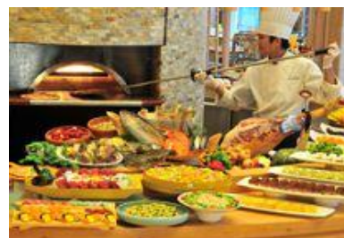
90種類以上のバイキング料理

○2013年5月2日(木)～5月5日(日)はゴールデンウィーク限定ディナーメニューとなります。