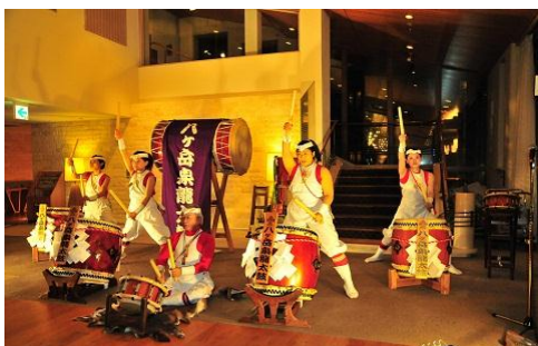
ハケ岳泉龍太鼓演奏

期間：2013年5月2日(木)～5月4日(土) 時間：20時30分～21時 場所：屋外「鯉のぼりの川渡し」実施場所付近 または館内ロビーにて開催