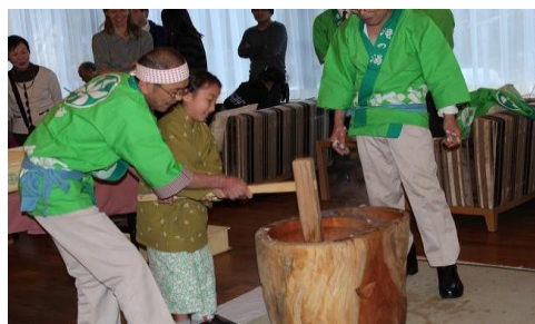
餅つきをする宿泊客とホテルスタッフ