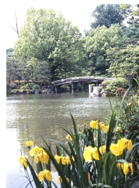
侵雪橋(しんせつきょう)