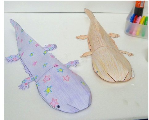
オオサンショウウオの特徴をたくさん見つけよう

特徴を見つけたら、ペーパークラフトに色を塗り、オリジナルの模型を作成してみます。オオサンショウウオの新たな発見が見つかるはずですよ。