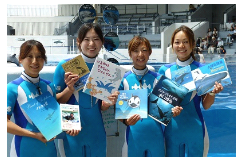
私たちがオススメしています