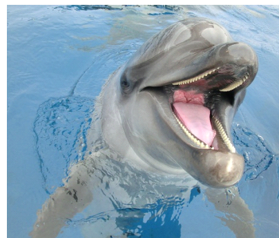
イルカたちがお待ちしています