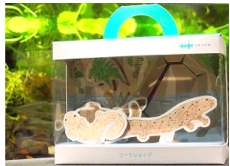
オオサンショウウオが泳ぐ取っ手付きのオリジナル水槽

このワークショップでは、京都水族館のオオサンショウウオが暮らす環境や、水槽の工夫などを楽しく学びながら、オリジナルの水槽を作ることができます。