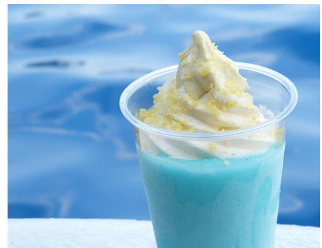
ほどよい甘さとシュワシュワのロどけが 新感覚のスイーツです