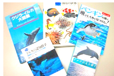
お気に入りの1冊を見つけてください (写真はイメージです)