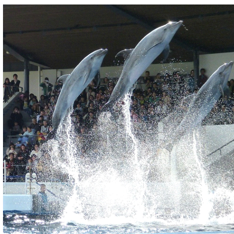
爽やかな水しぶきをあげて、夏の暑さを吹き飛ばそう