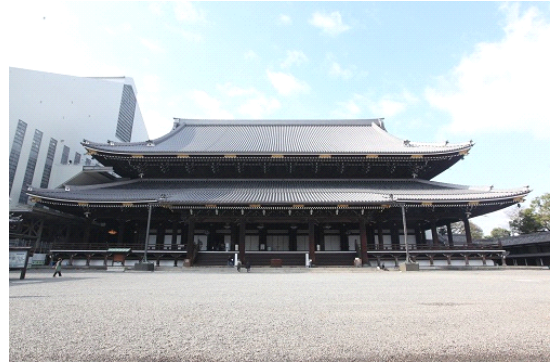
御影堂(ごえいどう)