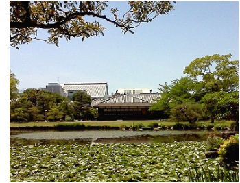
印月池(いんげつち)