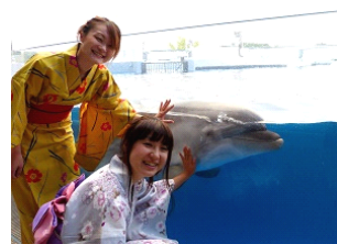
夏の思い出になること、間違いなしです。

「京都水族館の夏祭り」の期間中に浴衣などの和装でご来館いただいたお客さまのご入場料金が半額になるサマーキャンペーン「浴衣で行こう水族館！」を開催します。素敵な夏の思い出に、ぜひ浴衣などの和装で京都水族館に遊びに来てください。