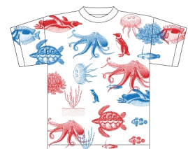
「アクア Tシャツ」のイメージ

京都水族館で生活するいきものを観察して、自分なりの水槽や水族館をイメージしたオリジナルTシャツを作ってみてはいかがでしょうか。