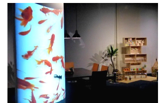
丸柱には金魚が泳ぐ姿を照明で演出