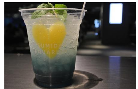
ズムシナイトカクテル