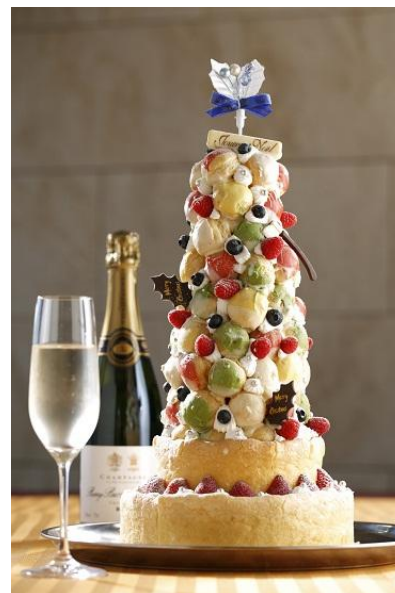
「クリスマス タワーケーキ」