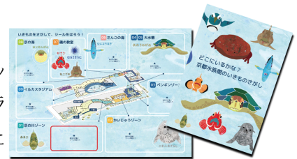
いきものシールとマップのイメージ

京都市立芸術大学院生がデザインした市バスに描かれている京都水族館のいきものを、館内を巡りながら探し、見つかったらいきものシールをマップに貼り付けます。その後、交流プラザに掲示しているラッピングバスのイラストとご自身で作成したマップをヒントにクイズに答えて応募すると、正解した方の中から抽選で合計104名様に、京都水族館オリジナル商品や、「市バス専用一日乗車券カード(京都市立芸術大学デザイン版)」をプレゼントします。