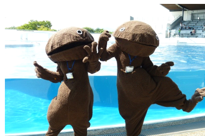
動きがとってもキュートなオオサンショウウオ

開催日時：2013 年 10 月 26 日(土)・10 月 27 日(日) 9 時 00 分～17 時 00 分