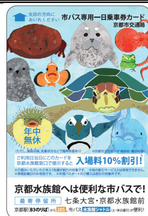
「市バス専用一日乗車券カード (京都市立芸術大学デザイン版)」