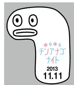
チンアナゴのお面