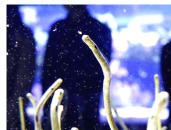
「食べる」チンアナゴ