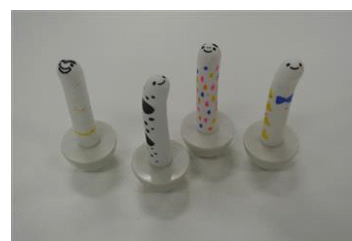
ゆらゆらチンアナゴ