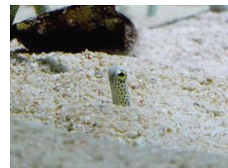
「隠れる」チンアナゴ

開催時間：18時～21時 開催場所：館内各所 賞品の定員：先着20名 賞品の受け取り場所：5階 総合案内所