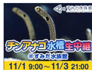
チンアナゴ水槽生中継@すみだ水族館

番組名：チンアナゴ水槽生中継@すみだ水族館 放送日時：2013年11月1日(金) 9時～2013年11月3日(日) 21時 視聴URL： http://live.nicovideo.jp/watch/lv156051445 撮影場所：すみだ水族館 放送内容：チンアナゴ水槽生中継 閉館後ツアー「ナイトクルージング」 オリジナルフィギュア「ゆらゆらチンアナゴ」のUFOキャッチャーつかみ取り など