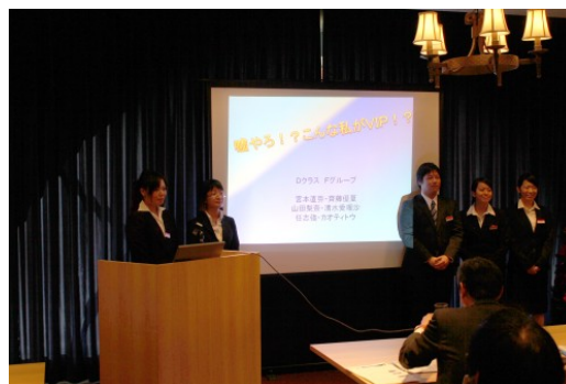
昨年の最終プレゼンの様子

今年も、授業やプレゼンテーションを行い、カップル向けプラン、グループ向けプラン、贅沢プランの3つ(予定)を商品化し、2013年12月に販売を開始します。学生の視点を生かして開発した宿泊プランに、是非ご期待ください。