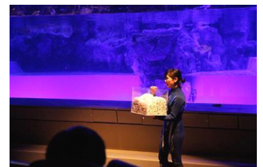
ペンギンチャット

※期間中のキャンペーンとしてアクアバー・ペンギンカフェで商品を購入された先着100名の方へ小笠原村の名産品「島トマト」をプレゼントします。