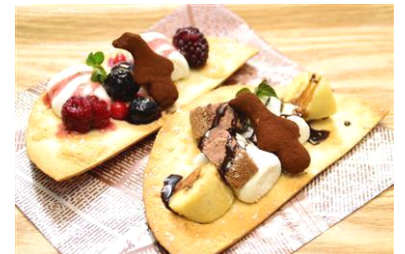
スウィートペンギンピザ

商品名：スウィートペンギンピザ 販売価格：400円(税込み) 販売期間：2014年2月14日(金)～3月16日(日) 商品紹介：チョコムース&バナナ、ベリーの2種類のスイーツピザはとろけたマシュマロとの相性抜群です。