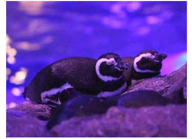
寄り添って眠るローズ(♂)とススキ(♀)

開催日：2014年2月14日(金)～3月16日(日) 開催場所：5階 ペンギンカフェ付近 アルバム数：9冊 カップル紹介：「カリン(♂)」と「カクテル(♀)」、「クローバー(♂)」と「イチゴ(♀)」、「ゆず(♂)」と「イチゴ(♀)」、「ローズ(♂)」と「ススキ(♀)」、「マロン(♂)」と「バナナ(♀)」、「バジル(♂)」と「わらび(♀)」、「サワー(♂)」と「モミジ(♀)」、「アケビ(♂)」と「フジ(♀)」、「ポテチ(♂)」と「リンゴ(♀)」