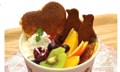
スウィートペンギンパフェ

商品名：スウィートペンギンパフェ 販売価格：500円(税込み) 販売期間：2014年2月14日(金)～3月16日(日) 商品紹介：たくさんのフルーツと期間限定のココア味のペンギンクッキーが、ラブラブな二人を盛り上げます。