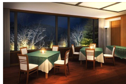
森のレストラン「ルシェール」

「森」をイメージした会場は、南側の大きな窓から望む白樺や唐松の森林に包み込まれる空間です。夜はライトアップにより幻想的な空間を提供します。