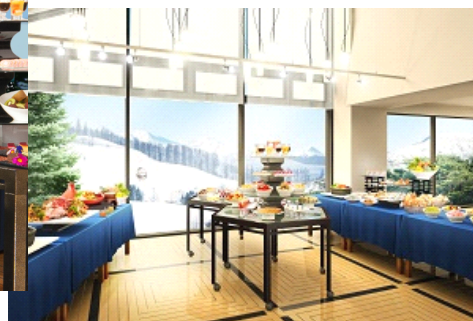
天空のレストラン「アチェーソ」からの眺望