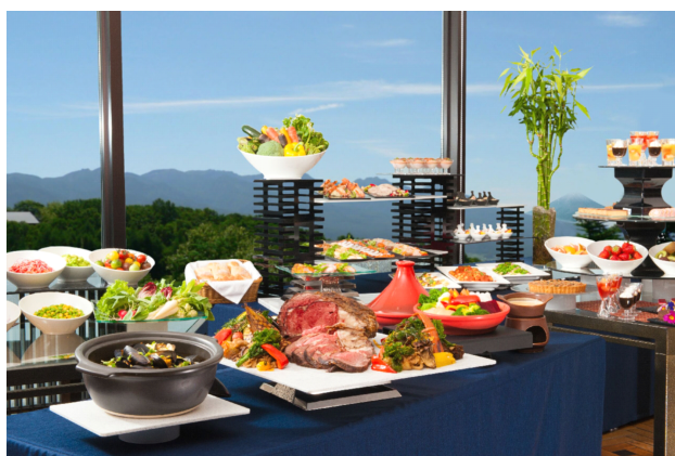
天空のレストラン「アチェーソ」バイキング料理

高原リゾートのご滞在をより豊かに彩る食の時間を、自然に満ちたレストランとメニューでお楽しみください。