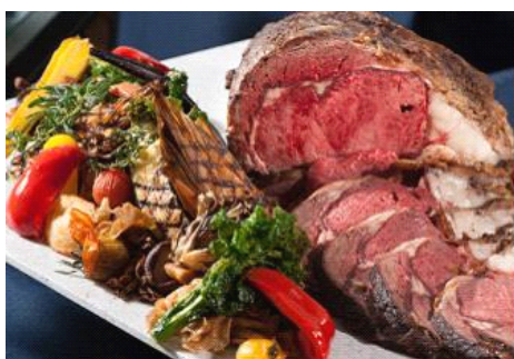
バイキング料理 (イメージ)

信州の食材を採り入れたメニューや、お客さまに人気のローストビーフやパスタなど、全 55 品目のディナーバイキングです。眺めて歩くだけでも心弾むようなパフォーマンスやレイアウトにもご注目ください。