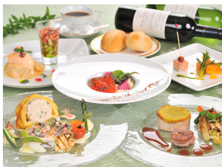
基本コース料理(イメージ) ※メインは魚か肉を選択

八ヶ岳の高原野菜や旬の食材を用いてシェフが腕を振るう「創作フレンチ」をご提供します。季節感にあふれ、目でも舌でもお楽しみいただくことができます。旅の思い出になるようなコースをご用意しました。