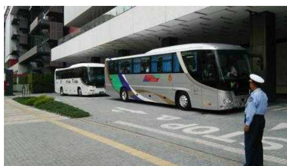
インセンティブツアーの様子(北館1階車寄せ)