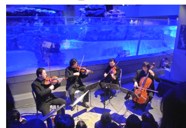
『新日本フィルハーモニー交響楽団』

開催内容：ペンギンたちが寝る準備を始める、夜の 「すみだ水族館」で新日本フィルハーモニー 交響楽団のアンサンブルが演奏会を行います。 時折、ペンギンたちも鳴き声で演奏に加わり 演奏会を盛り上げます。