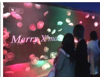
『クラゲのメリークリスマス』

展示名称：『クラゲのメリークリスマス』 展示期間：2014 年 12 月 25 日 (木) まで展示 展示時間：終日開催 展示場所：ミズクラゲ水槽 開催内容：ミズクラゲの水槽を期間限定で赤と緑に移り変わるクリスマスカラーの照明でライトアップします。