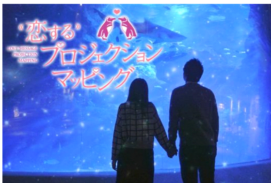
『恋する投影マッピング』 ※イメージ