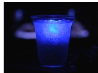
『ブルーナイトカクテル』

商品名：『ブルーナイトカクテル』 販売価格：620 円 (税込み) ※ノンアルコールは 500 円 (税込み) 販売期間：2015 年 1 月 12 日 (月・祝) まで販売 販売時間：18 時 00 分～21 時 00 分 販売場所：5 階 ペンギンカフェ 商品内容：青く光る LED の入った氷型キューブが浮かぶ柑橘リキュールのカクテルです。 カクテルを片手に夜の演奏会をお楽しみください。