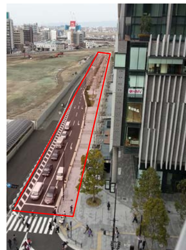
「いちよう並木」特設会場

グランフロント大阪では、多様な人々との交流を通じて新しい発見やアイデアを生み出す「参加型のまちづくり」を進めており、本イベントでは、最新型パーソナルモビリティの体験や障がいがありながら世界で活躍するトップアスリートによる迫力のパフォーマンス、100人ヨガや水上 SUP ヨガなど、健康づくりにつながる幅広い参加型のプログラムを通じて、体の健康を見つめ直すとともに、お互いを受け入れ、認め合うという先進医療都市にふさわしい都市住民としての心のバリアフリーを育むことを目指しております。