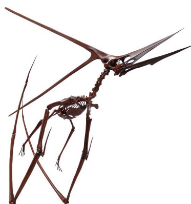
(左)「ケープペンギン」と(右)翼竜の仲間

「ペンギンゾーン」では、鳥類に姿がよく似た翼竜の仲間の全身骨格標本と、現代の鳥類であるペンギンとの体のつくりの違いなどを紹介します。これらの骨格標本とペンギンとを比較しながら、空を飛んでいた翼竜と飛べない現代の鳥類ペンギンとの違いについて学ぶことができます。