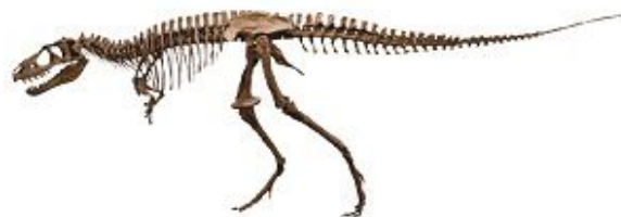
ティラノサウルスの仲間「ゴルゴサウルス」