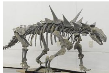
(左)「オオサンショウウオ」と(右)「アニマンタルクス」