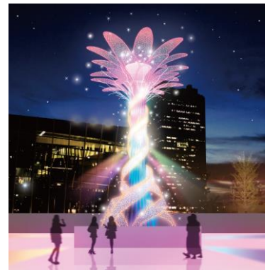
「エモーショナル・クリスマスツリー」 参考画像