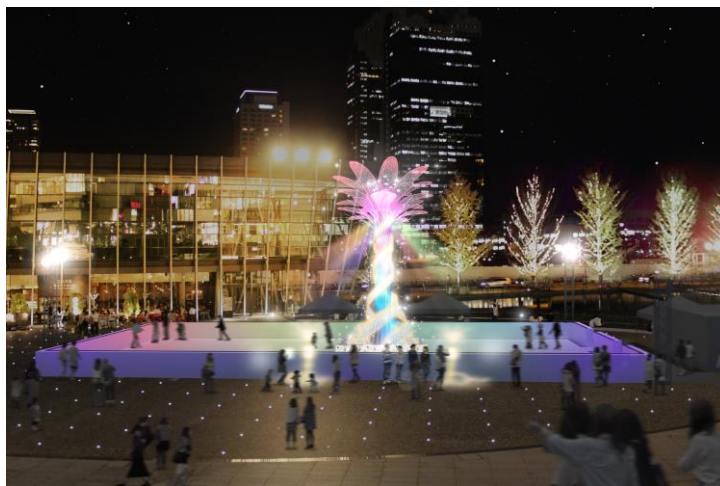
「うめきた広場」イメージ写真