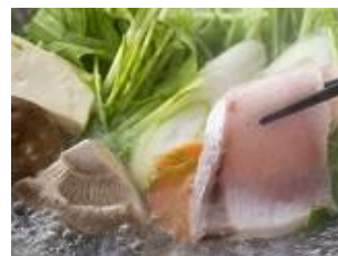
鰯しゃぶ ※有料別注料理