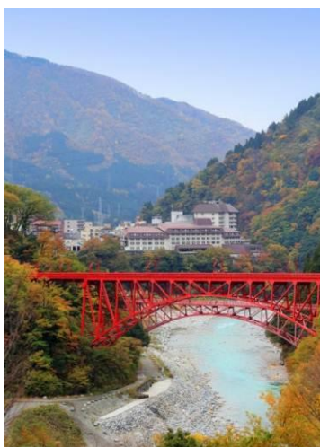
「新山彦橋」側から望むホテル外観