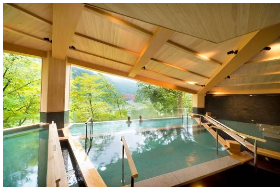
展望露天風呂「棚湯」(外湯)