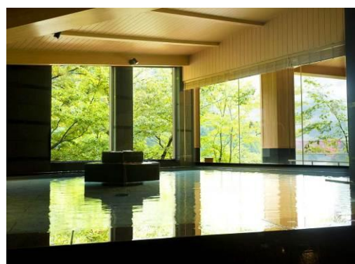
展望露天風呂「棚湯」(内湯)