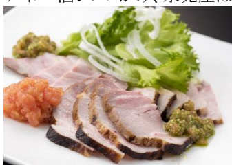
黒部名水ポークの塩麴漬け トマトドレッシングがけ

メニュー:(北 陸)富山短期大学の学生考案のメニュー8品>>>黒部名水ポークのソテー キノコクリーム、黒部名水ポークの塩麴漬け トマトドレッシングがけ、カニの かぶら蒸し、甘エビとタコのカクテルサラダ、リンゴのシフォンケーキ、干し柿 アイス 酒ジュレがけ、氷見産はとむぎ茶プリン、リンゴを使ったクリームケーキ