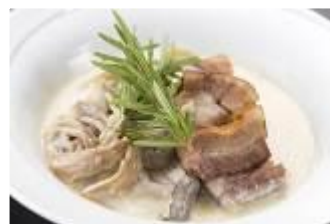
富山短期大学の学生が考案した 黒部名水ポークのソテー キノコクリーム

また、12月1日よりバイキングレストラン「Seeds(シーズ)」にて「冬のうまいもんバイキング～富山と全国ご当地グルメ～」を開催します。北陸地方をはじめ、日本各地の名物料理をバイキング形式でご提供します。特に、北陸地方のメニューは、地元とのコラボレーション企画として富山短期大学(富山県富山市、学長:中島 恭一)の食物栄養学科の学生が考案したメニューをコンテストにより選出し、ご提供します。コンテストでは、オリックスグループ統括総料理長を務めるローラン・ジャンマリー氏も審査員として加わり、富山の食材を存分に生かした8品がメニューに選ばれました。全国各地の名物料理とともに、富山の学生が考案した若い感性にあふれるオリジナルメニューをご賞味ください。