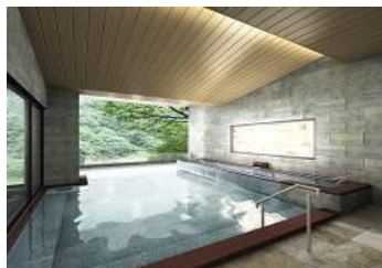
大黒部(露天風呂)イメージ

『宇奈月 杉乃井ホテル』は、黒部峡谷沿いの美しい眺望を楽しめ、多くのお客さまに愛されています。2015年9月には展望露天風呂「棚湯」を新設し、お客さまに大変ご好評をいただいておりますが、このたび、棚湯とは違った雰囲気のあるお風呂をお客さまに満喫していただくため、大浴場「大黒部」のリニューアルを行いました。露天風呂を拡張し源泉かけ流しとし、内装は峡谷をモチーフに改修し、「大黒部」の名のとおり黒部のダイナミックさを感じていただくことのできるお風呂になりました。内風呂は、露天風呂へ続く峡谷風の床タイルと、浴槽内には上流の透き通った川のイメージの自然石により、露天風呂とつながりを持たせた改修を行いました。宇奈月温泉街随一の広さを誇る大浴場「大黒部」にて黒部峡谷の絶景とともに豊富な湯量の宇奈月温泉「美肌の湯」をお楽しみください。