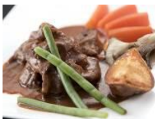
下町のビーフシチュー

( 関 東 ) 下町のビーフシチュー、ねぎま鍋、甘海老のフラン・蕪(かぶら)のスープ、 天麩羅、べったら漬