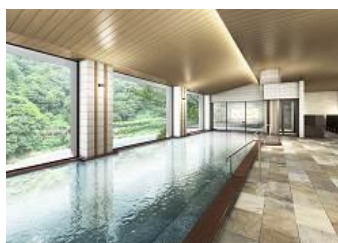
大黒部(内風呂)イメージ