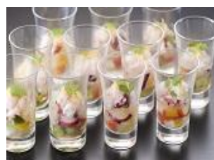
甘エビとタコのカクテルサラダ

富山の握り寿司、鰯しゃぶ(有料別注料理)、合鴨治部煮、茸汁、大根寿し、 富山ブラックラーメン、ブラックカレー