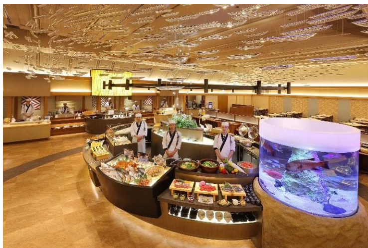
バイキングレストラン「Seeds(シーズ)」