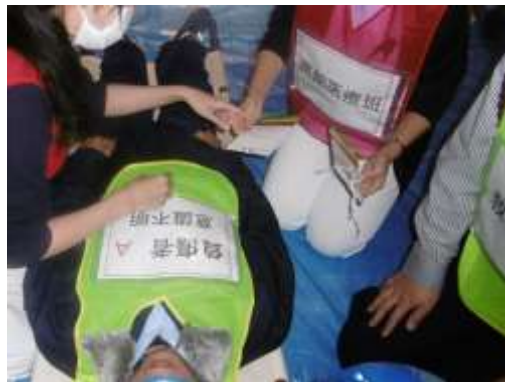
トリアージの実施(南館)