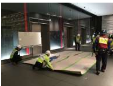
仮救護所立ち上げの様子（北館）

グランフロント大阪では建物の耐震性確保等の各種災害予防策のほか、大阪市北区からの要請を受け「津波避難ビル」の指定受け入れ等、ハード・ソフトの両面での災害対策を講じています。今後とも所轄消防署や各テナント企業の皆様の協力のもと、安全・安心なまちづくりを目指して参ります。