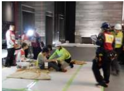
負傷者対応の様子（北館）