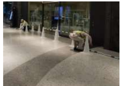
帰宅困難者対応スペース設営の様子（北館）