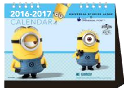
※画像はイメージです。

※ミニオンルームにご宿泊のお客さまおよびホテル公式WEBサイトから ご予約のうえ、上記期間中にご宿泊いただいた方への限定サービスです。 ※期間・特典は予告なく変更になる場合がございます。