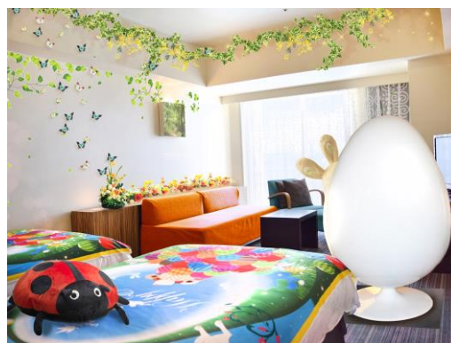
「秘密の森の隠れ家へようこそ☆イースタールーム」