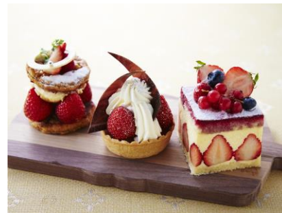
旬の苺をたっぷり使用