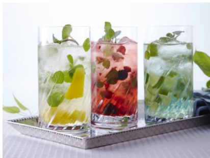
ミントが香る爽やかなモヒートカクテル