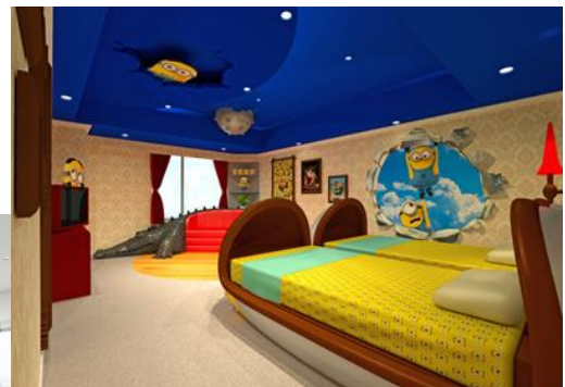
TM & © 2016 Universal Studios. © & ® Universal Studios. All rights reserved.