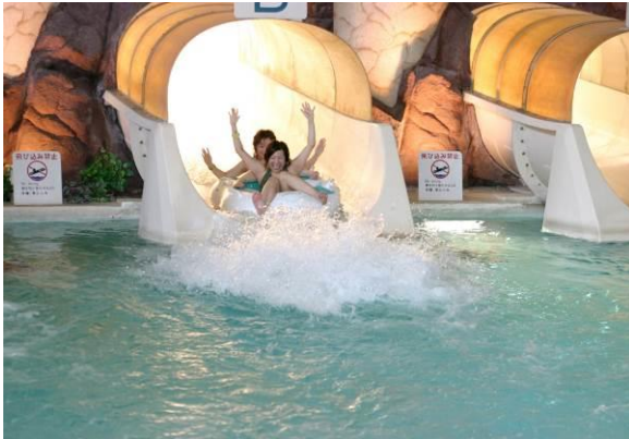
虹や星座バージョンも加わった「ウォータースライダー」