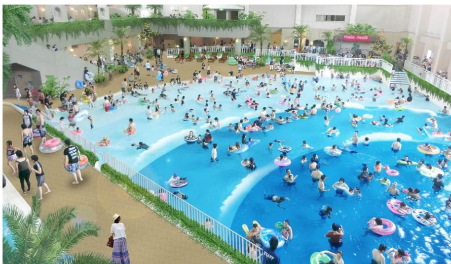
「アクアビーチ」イメージ