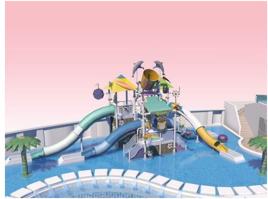
新設「ウォータージャングルジム」