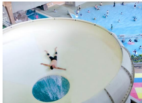
スリル満点「スーパールーレット」