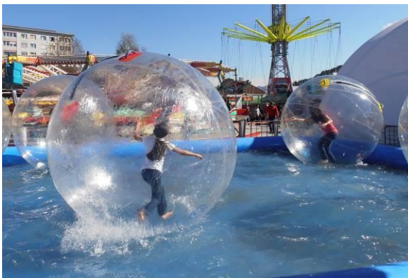
新アトラクション「ウォーターボール」(有料)