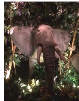
洞窟のような「ミステリードーク」に動物の模型が登場