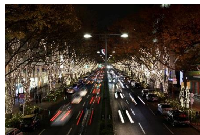
表参道 H. I. S. イルミネーション ベルシンフォニー (2009年)

桑沢デザイン研究所卒業。2004年ベルベッタ・デザイン設立。 【空気をデザインする】をテーマに、空間に関わる様々なクリエイションを手掛ける。近年の代表作として表参道イルミネーション、銀座イルミネーション『希望の翼』等、大型商業施設のクリスマスデザインを演出。スプツニ子!『Tranceflora - エイミの光るシルク』展、日本橋桜フェスティバル、『日本桜風街道』等のエキシビション・イベントにおける空間も演出。日産デザインセンター等の企業コミュニケーションスペース、商業店舗の内装からCIデザイン、プロダクトデザイン、グラフィックデザイン等、その活躍の場は多岐に渡る。2013年東京デザイナーズウィークでは、28年の歴史で初の女性クリエイターとして会場デザインを手掛ける。以来、ミラノ会場においても会場デザインに携わる。フランス国民美術協会(S.N.B.A.)主催サロン展 2014年金賞／審査員賞金賞、DSA優秀賞ほか多数受賞。DESIGN ASSOCIATION NPO 理事。