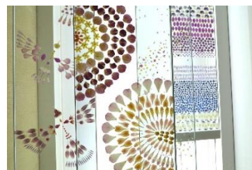
ミラノ国際博覧会日本館装花ディクション (花鳥風月、四季、地水火風) (2013年)

クリエイティブディレクター / 華道家 / フラワーアーティスト 青山学院大学経営学部卒業、慶應義塾大学大学院メディアデザイン研究科修了。 約600年続く華道の伝統や美学を意識しつつ、次世代の新たな表現方法を追求し、表現の場をストリートに求めたり、花に関係するファッションやプロダクト「IKEBANA KIT」から花贈りのウェブサービス「bouquet」を企画・制作するなど、生け花の枠に捕われない自由な活動を行っている。2007年、多様な手法を用いて花の魅力を発信するクリエイティブスタジオ「plantica」を結成。大型商業施設やリゾート施設の空間演出、NIKE、STARBUCKS、TOYOTA、SHISEIDOなどのイベント装花、CMや広告など多方面で装花ディクションを行なっている。2015年、ミラノ国際博覧会(万博)日本館にて装花ディクション(花鳥風月、四季、地水火風)を担当する。次世代を担う文化人としてUNIQLOのTVCM/広告にフリース・アンバサダーとして出演(2009, 2014年)、またフランス放送局「Canal Plus」や海外放送「NHK World」「Design Talks」のドキュメンタリー番組に取材されるなど、国内外のメディアからも活動が目目されている。