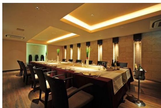
ダイニング・アネックスでの晩餐会(イメージ)