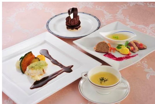
6日間のみ1日10食限定1,000円特別ランチコース