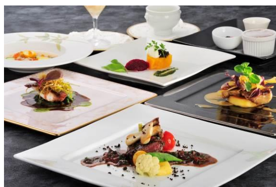
料理長渾身のフランス料理特別コース(イメージ)