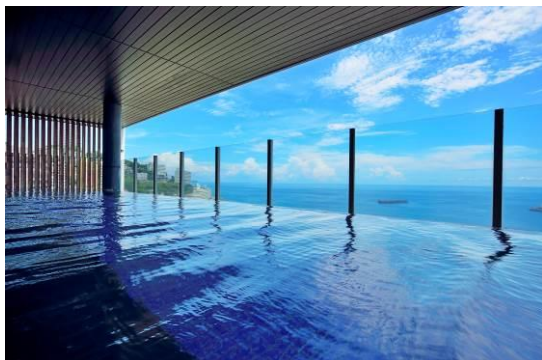
相模湾の絶景と自家源泉を楽しめる展望風呂