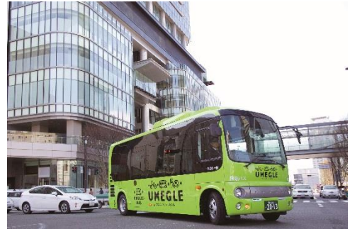
写真は通常のうめぐるバス