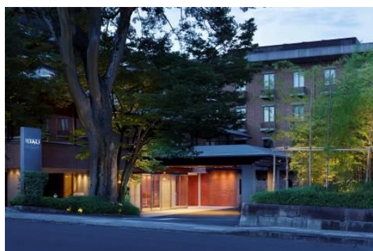
ハイアット リージェンシー 京都

オリックス不動産が運営する宿泊施設は、今後もお客さまにご満足いただけるホテルを目指してまいります。