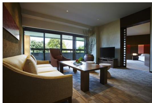
KYOTO 스위트 リビングルーム