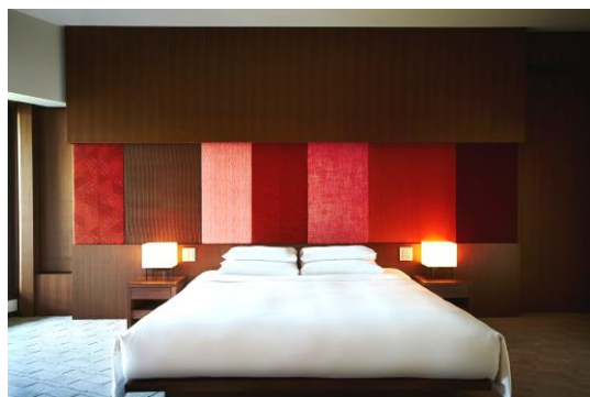
KYOTO 스위트 キング ベッドルーム