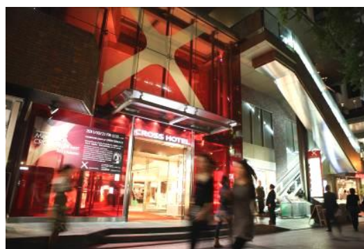
クロスホテル大阪