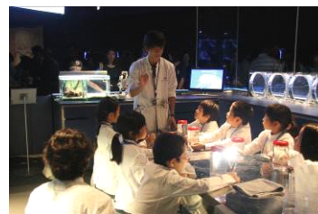
「クラゲ研究員」開催の様子

開催内容：飼育スタッフと同じ白衣を着て、クラゲについて研究するプログラムです。クラゲをより身近に感じることができます。