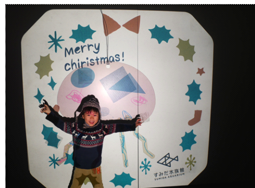
「クラゲうつし～クリスマス限定 ver～」

開催内容：透明の素材で自分だけのクラゲのオーナメントをつくれます。クリスマスのフレームで飾られた壁面の大きなスクリーンに投影して遊んでみましょう。自分でつくった大きなクラゲと一緒に記念撮影もすることができます。また、作ったクラゲを館内のクリスマスツリーに飾り付けることもできます。