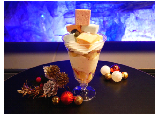
「東京クラゲツリーパフェ」(イメージ)

販売価格：800円(税込) ※1日30食限定 販売期間：2016年12月23日(金・祝)～12月25日(日) 販売場所：5階 ペンギンカフェ 商品内容：ふわふわとした柔らかな食感と、カラフルな見た目を楽しめるフランスの洋菓子「ギモーヴ(マシュマロ)」を積み重ねて「東京クラゲツリー」を表現したパフェです。ふわふわのギモーヴとスポンジケーキを、いちごソース添えのバニラアイスとぜひ一緒に味わってください。