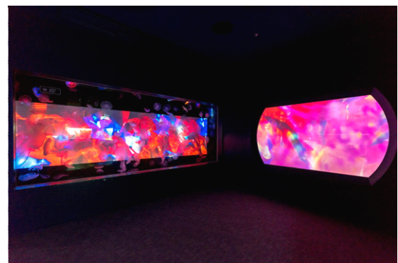
蜷川実花とクラゲのコラボレーション展示

写真家・映画監督の蜷川実花氏とクラゲの幻想的なコラボレーション展示「蜷川実花×クラゲ」も好評開催中です。今年のクリスマスは、いきものたちと一緒にロマンチックなひと時を楽しめる、クラゲづくしの『すみだ水族館』にぜひお越しください。