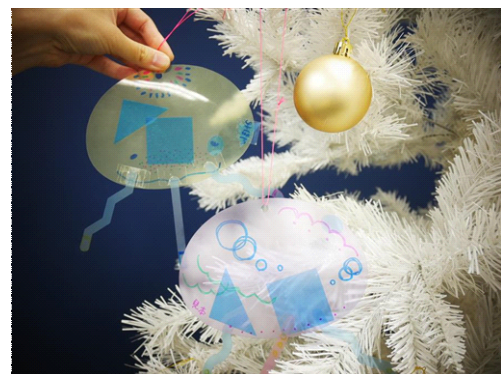
クラゲのオーナメント(イメージ)