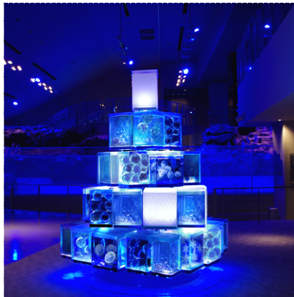
「東京クラゲツリー」(イメージ)

『すみだ水族館』(所在地：東京都墨田区、館長：山内 将生)では、2016年12月2日(金)から12月25日(日)まで、キューブ型水槽41個を5段に積み上げた光と水のクリスマスツリー「東京クラゲツリー」を中心に、『すみだ水族館』でロマンチックなクリスマスをお過ごしできるクラゲづくしのイベント「クラゲと恋するクリスマス」を開催しますので、お知らせします。