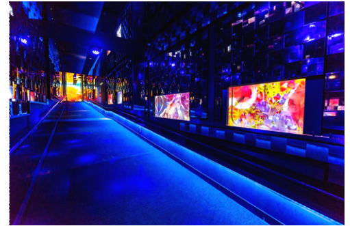
クラゲ万華鏡トンネル

展示内容：壁と天井の3面が約5,000枚の鏡で囲まれた全長約50メートルのスロープで、8つのクラゲ水槽と壁面に、蛭川実花氏の映像作品を投影します。浮遊するクラゲと照明、アロマ、そして蛭川実花氏の作品によって常に表情を変えるトンネル内で、クラゲと一緒に鏡の中の世界を漂っているような体験ができます。