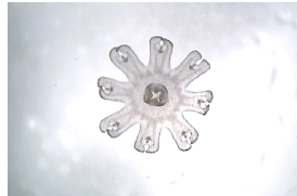
クラゲの赤ちゃん「エフィラ」

また、現在開催している体験プログラム「クラゲうつし」も期間限定でクリスマスバージョンになって登場します。透明な素材で自分だけのクラゲのオーナメントを作り、クリスマス用のフレームで飾られたスクリーンに投影して遊んだり、館内のクリスマスツリーに飾り付けることができます。