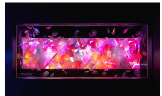
幅約4mの大型クラゲ水槽

展示場所：6F「クラゲ」ゾーン 展示期間：2016年11月8日(火)～2017年3月14日(火) 展示時間：終日開催 展示内容：幅約4メートル、高さ約1.5メートルの大型のクラゲ水槽や、8種類のさまざまなクラゲを展示したU字型水槽があるクラゲ展示ゾーンを、蜷川実花氏の映像作品や写真で彩ります。 視界いっぱいに色彩の鮮やかさが広がる、大型水槽の圧倒的な美しさは必見です。 展示生物：ミズクラゲ、ブルージェリーフィッシュ、シロクラゲ、カブトクラゲ、アマクサクラゲ、アカクラゲ、ギヤマンクラゲ、イオリクラゲなど ※展示生物は変更になる場合があります。