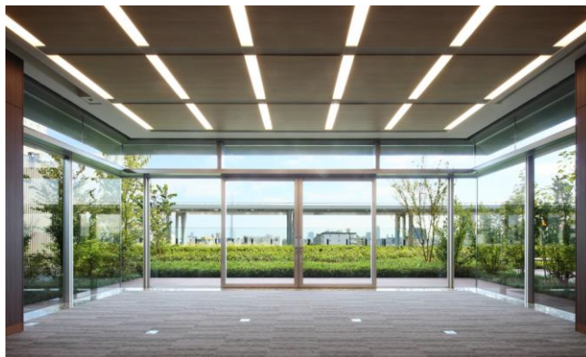
10階 カンファレンスルームと屋上庭園

オリックスでは、今後も環境に配慮したオフィス空間の提供により、企業の成長促進に寄与できるビルの開発に取り組んでまいります。