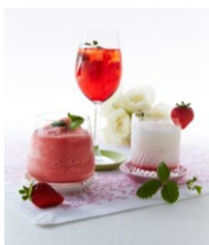
ラウンジ R “莓カクテルフェア”