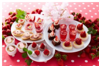
ポートダイニング リコリコ “春野菜とイタリア料理フェア”