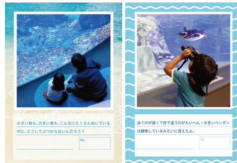
出展者のメッセージとともに部門限定のオリジナルフレームで作品を展示します

京都の源流から海へいたるまでのいのちのつながりを感じていただくことができる『京都水族館』、そして東京という都心にありながらも水に暮らすいきものたちを身近に感じていただくことができる『すみだ水族館』で、水に暮らすいきものに想いを巡らせながら出展者のメッセージが込められた作品をゆっくりとお楽しみください。