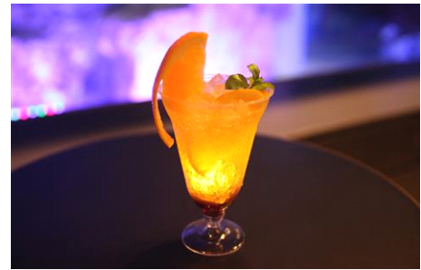
ほたるのひかりカクテル

販売期間：2017年6月14日(水)～6月18日(日) 販売時間：各日18時～21時 販売場所：5F ペンギンカフェ 販売価格：650円(税込) 販売内容：清流で光るホタルをイメージして作られたカクテルです。カシスソーダをベースに、夜空に浮かぶ月に見立てたオレンジや、さわやかな初夏の風を思わせるミントをあしらいました。