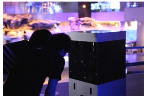
ホタルの展示風景 ※昨年の様子

展示内容：『すみだ水族館』にて、『東武動物公園』の「ほたるリウム」で飼育するヘイケボタルの展示を行います。また、館内のアクアアカデミーは期間限定でホタルについて学べる「ほたるの学校」として、ヘイケボタルの卵や幼虫の展示を行います。暗闇の中で光るホタルをご覧いただき、ぜひ、初夏の訪れを感じてみてください。