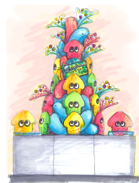
Suizokukaan ツリーを特別展示

「Suizokukaan～イカす夏休み～」オリジナルの描き起こしアートがプリントされた限定Tシャツやトートバッグをイベントオリジナルで販売します。また、オオサンショウウオのぬいぐるみとイカのぬいぐるみで制作されたSuizokukaan ツリーを特別展示します。