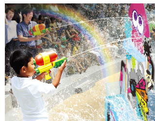
「スプラシューター」の水鉄砲を使って楽しむシューティング・バトル(イメージ)

「スイゾクカーン・スプラッシュタイム」は、イルカスタジアムに流れ落ちる幅約15mの巨大ウォーターカーテンの水と、ゲーム内に登場するブキ「スプラシューター」の水鉄砲などを使ってシューティングバトルし、親子で全身ずぶ濡れになって楽しめるイベントです。