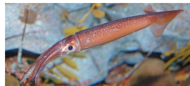
※イメージ(実際に展示するイカの仲間とは異なります)

『スプラトゥーン 2』に登場するキャラクター「インクリング」のモデルであるイカの仲間を特別展示します。通常は展示していない「アオリイカ」などのイカの仲間をじっくりと観察できるほか、生態に関する解説パネルでイカについて楽しく学ぶことができます。