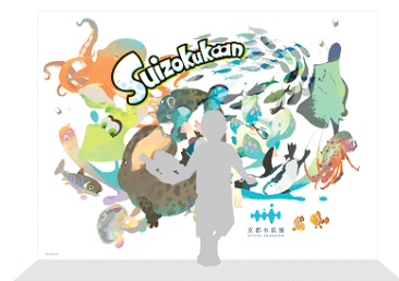
オリジナルフォトロケーション(イメージ)

『スプラトゥーン 2』に登場するイカのキャラクター「インクリング」と京都水族館で展示している人気のいきものたちがコラボレーションした「Suizokukaan～イカす夏休み～」オリジナル描き起こしアートが館内に登場し、キャラクターたちと一緒にまるで水槽の中に入ったかのように記念撮影することができます。