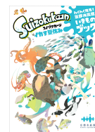
シール付き(イメージ)

クイズにチャレンジしたり、見つけたいきもののシールを貼って京都水族館を楽しむことができる「わくわく発見！京都水族館いきものブック Suizokukaan～イカす夏休み～」が登場します。