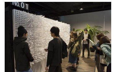
「INTERNATIONAL STUDENTS CREATIVE AWARD (ISCA) 2016」の様子

本アワードは、ナレッジキャピタルが実施する3大アワードの1つで、国内外の大学や大学院、専門学校の学生を対象に、学校教員単位で応募する国際的なクリエイティブアワードです。