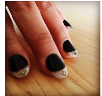
Beauty Tech Nails

この特別なネイルチップをつけ、日常的な動作をすることで、さまざまなデバイスやサウンドのコントロールが可能になる様子を体感していただけます。