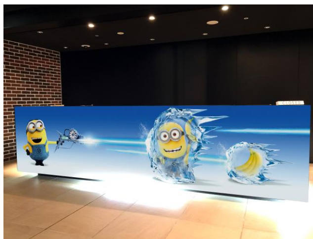
DAVE が仲間を凍らせちゃった？！

全長約115mのロビーに広がる窓には、プール遊びを楽しむミニオンたち。そこに「巨大凍らせ銃」が突然現れて、大あばれ！プールはあっという間に凍りつき、ミニオンたちが次々と・・・？！