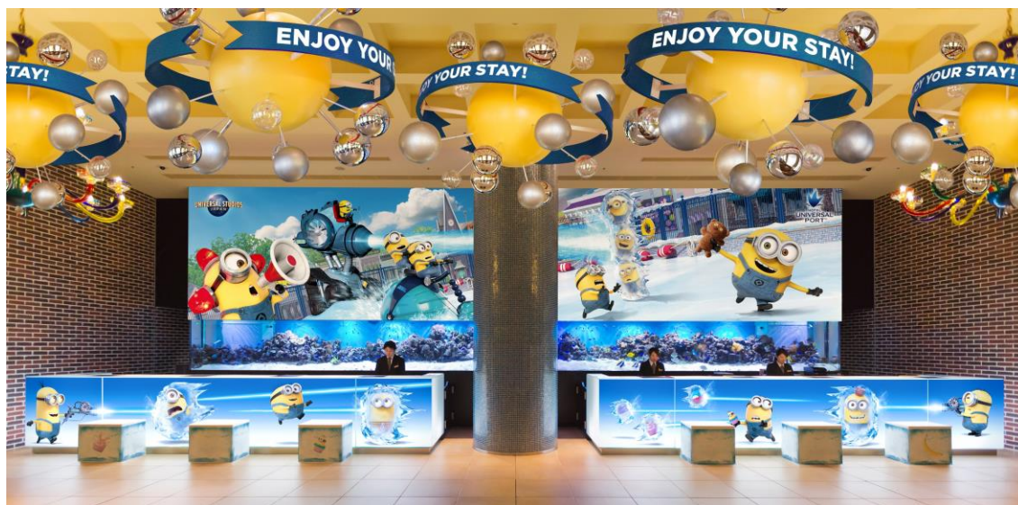
『ミニオン・ハチャメチャ・アイス・デコレーション』（イメージ）

ユニバーサル・スタジオ・ジャパン・オフィシャルホテル『ホテル ユニバーサル ポート』（所在地：大阪府大阪市此花区、総支配人：金井 紀生）は、2018年7月15日（日）より、パークの人気者「ミニオン」が繰り広げる、ハチャメチャで愉快的なロビー装飾「ミニオン・ハチャメチャ・アイス・デコレーション」を開始しました。