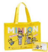
限定アメニティのランドリーバッグと アメニティポーチ