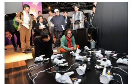
「ISCA 2017」デジタルコンテンツ部門審査の様子

開催両日は、国内外の審査員ならびに全受賞者が集結し、厳正な審査の結果、全26の受賞作品を発表します。