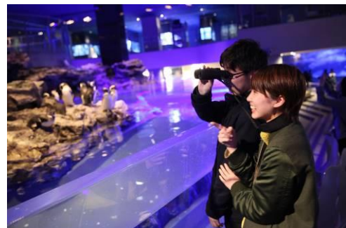
「みるみるペンギン」イメージ