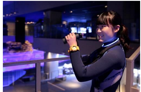
「ペンギンワッチ」イメージ

開催内容：毎週水曜日の夜に開催している、大人向け体験プログラム「ペンギンワッチ」をイベント期間中は毎週金曜日にも開催します。「ペンギンワッチ」は、高品質な双眼鏡を使用して、夜のペンギンたちを飼育スタッフと一緒に観察するプログラムです。また、「ペンギンワッチ」開催日以外は、双眼鏡をお客さまに貸出し自由に夜のペンギンたちを観察できる「みるみるペンギン」を開催します。「みるみるペンギン」では、参加者に飼育スタッフのおススメ観察スポットマップをお渡しします。夜の時間になると、カップルのペンギンたちがびったり寄り添って眠っているようすなどを観察できます。