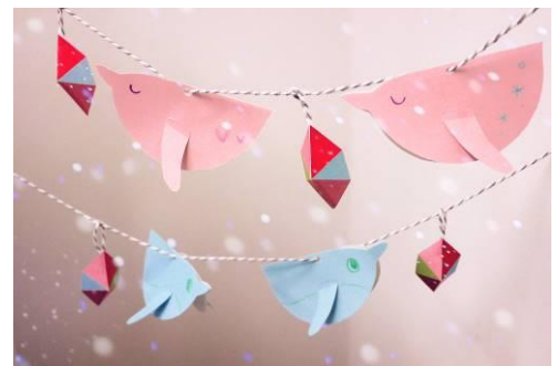
「ペンギンメッセージガーランド」イメージ

開催内容：クリスマスツリーにも飾ることができる、ペンギンのガーランドを作成します。ペンギンのオーナメントにはメッセージを書くこともできるので、大切な人へのプレゼントとしてもおすすめです。