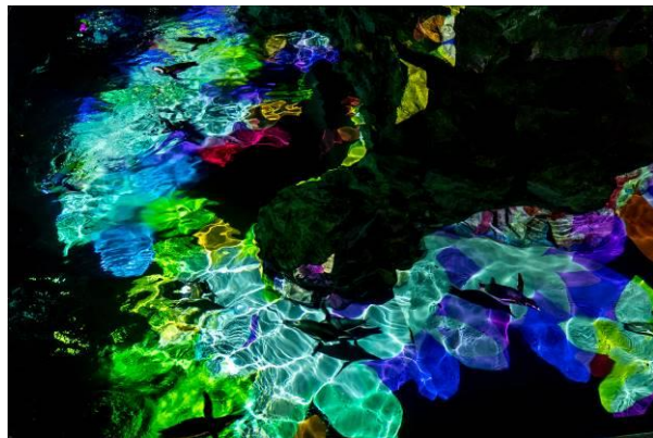
プロジェクションマッピング「Penguin Candy」

すみだ水族館(所在地:東京都墨田区、館長:名倉 寿一)は、2018年11月22日(木)～12月25日(火)、館内がクリスマスモードに包まれる「ペンギンと過ごすクリスマス」を開催します。期間中はプロジェクションマッピング「Penguin Candy(ペンギン キャンディ)」※にクリスマスアレンジを追加した特別バージョンを毎日2回にわたって映写します。