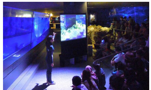
「ペンギンライブ」イメージ

開催内容：日々ペンギンを近くで見守っている飼育スタッフが、ペンギンたち1羽1羽の個性やクリスマスシーズンにちなんで恋愛模様などに触れながら、リアルタイムに“ペンギンたちの今”をお客さまに語りかけるトークライブです。