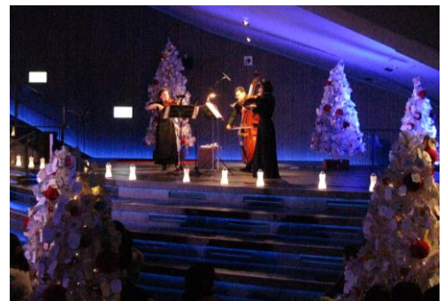
過去開催時のようす

開催内容：夜の水族館でクリスマスソングの演奏会を行います。新日本フィルハーモニー交響楽団が奏でる弦楽器や木管楽器の音色に時折りペンギンたちの鳴き声が変わり、演奏会を盛り上げます。「ペンギンと音楽の夜」開催中は、特別にプロジェクションマッピング「Penguin Candy」の音楽に、楽団の生演奏も加わります。