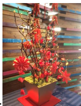
※写真は昨年のものです。