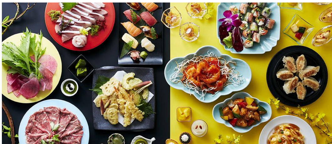
※ディナーbuffet「和とチャイナフェア」イメージ

ユニバーサル・スタジオ・ジャパン・オフィシャルホテル『ホテル ユニバーサル ポート』（所在地：大阪市此花区、総支配人：金井 紀生）は、ホテル2階「ポートダイニング リュッコ」にて、2019年1月9日（水）～3月31日（日）の期間、冬のディナーbuffet「和とチャイナフェア」を開催します。