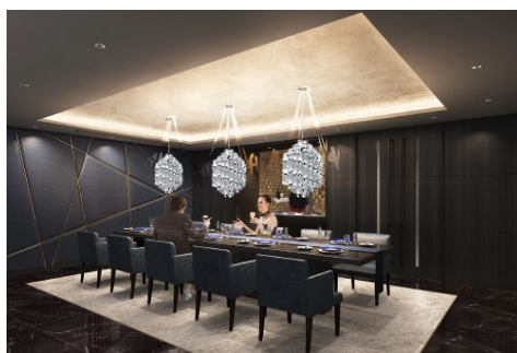
PRIVATE DINING イメージ

大人の隠れ家のようなVIPルーム。プライベートラウンジも併設しています。ご家族の食事会から接待などのビジネスまで、さまざまな用途にご利用いただけます。