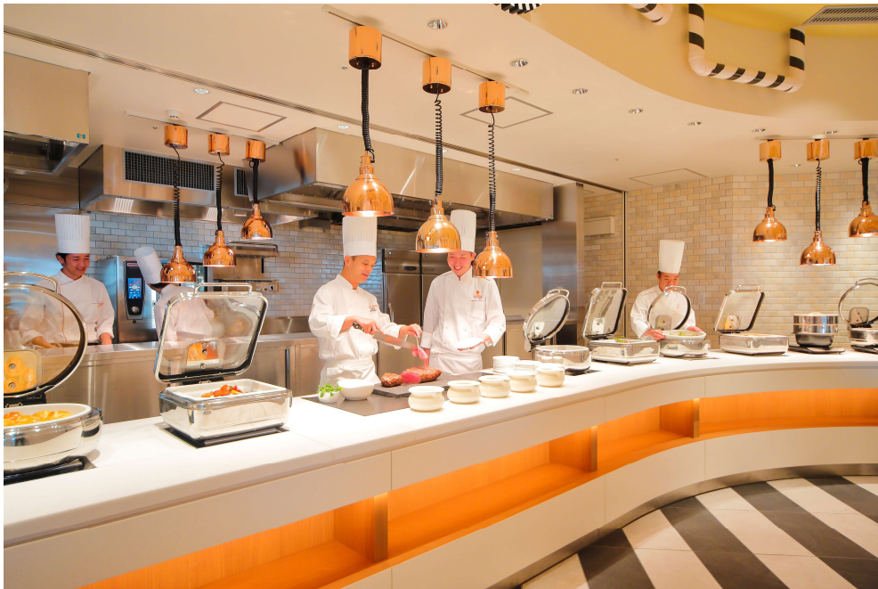
ヴィータ ダイニング ソリス グラーティア（イメージ）