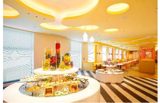
ホテルユニバーサルポートヴィータ レストラン会場

西九条にある子ども食堂に通う40名の小学生を招待し、ホテルユニバーサルポートヴィータのホテル館内探検ツアーを行います。また、ホテルの朝食ビュッフェにて提供しているミックスジュース作り体験も行います。体験後、ミニビュッフェをお楽しみいただきながら“食の楽しさ”やホテルクルーとの交流を楽しんでいただきます。