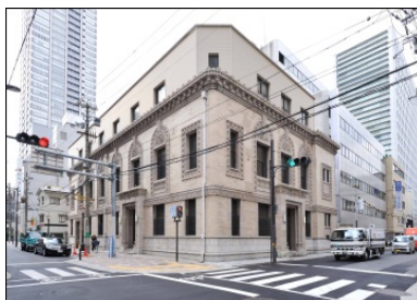
國枝博 改修設計後のビル外観