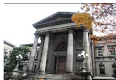
大阪府立中之島図書館