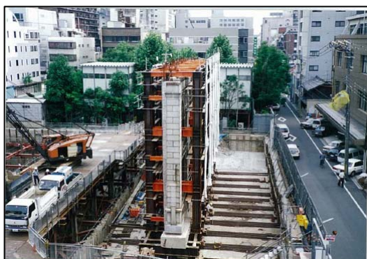
既設外壁の補強鉄骨ごと移動