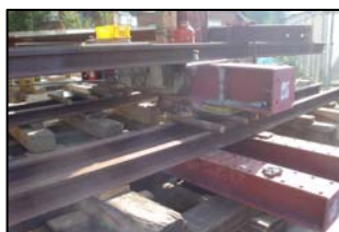
「コロ棒」による横曳き