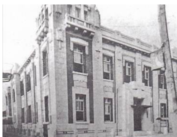
辰野片岡建築事務所設計当初のビル外観

本プロジェクトの外壁に活用する既存建物は、1918年に大阪で辰野片岡建築事務所の設計により大阪農工銀行として竣工した後、1929年に繊細で華やかな装飾を得意とする國枝博により全面的な改修設計が行われ、アラベスク文様のテラコッタで全体が覆われています(当初は2階建て、後年3階部分を増築改修)。本プロジェクトでは、この歴史的建造物の外観を保存することを目的に「曳家工法」を採用し、当時の意匠を残したままに、新たに内層に居住空間を取り入れます。