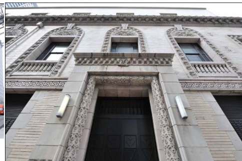
増築改修後のビル外観