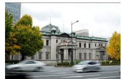
日本銀行大阪支店