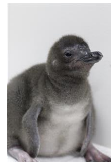
生後12日目の赤ちゃん