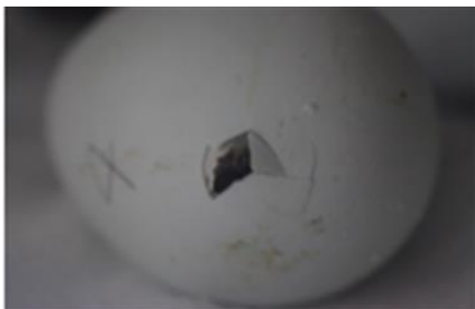
嘴打ちが始まった卵

生まれたばかりの赤ちゃんは、現在体長15センチほどですが、1ヶ月程で成鳥(体長50~60センチ)とほぼ変わらない大きさまで成長します。この時期にしか見ることができない生後間もないかわいいペンギンの赤ちゃんの様子と、赤ちゃんを見守る飼育スタッフの愛情をぜひご覧ください。