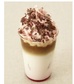
スイートでキュートなバレンタイン限定ドリンク

期間: 2014年2月1日(土)~14日(金) 8:00~23:00(ラストオーダー22:30) 場所: グランフロント大阪北館 ナレッジキャピタル1階「カフェラボ」 価格: 各530円(税込み)