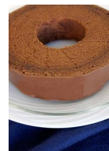
ユーハイムのチョコレート バームクーヘン