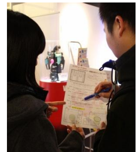
15の展示ブースを体験しながらクイズに答えよう!

期間: 2014年2月1日(土)~14日(金) 10:00~21:00 場所: グランフロント大阪北館 ナレッジキャピタル2、3階「アクティブラボ」 参加料: 無料