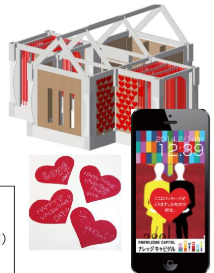
「みんなで作っていく赤いハート」のバレンタインハウス。記念フォトをプレゼント。

ハート型のダンボールのメッセージカードに大切な人への想いを書き、ダンボールアートのペーパーハウス「バレンタインハウス」の家に貼って彩るワークショップを開催します。また、特別なソファに座り、プロのカメラマンによるフォト撮影を行います。撮影した写真は、ナレッジフォトフレームに入れてメッセージとともに、携帯電話やスマートフォンにメールで14日(金)のバレンタインデーに合わせてプレゼントします。