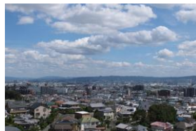
「グッドタイム リビング 千里ひなたが丘」 からの眺望:平成26年9月撮影