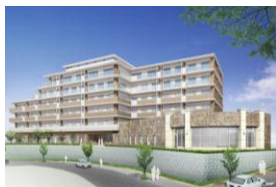
「グッドタイム リビング 千里ひなたが丘」 外観パース

大阪市外を一望できる開放的な眺望とともに、お食事を味わう優雅なひとときをご堪能いただけます。