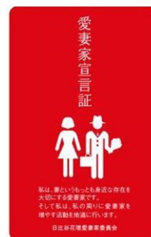
日比谷花壇特製 愛妻家宣言証