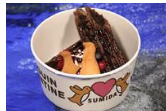
ペンギンチュリトス

販売内容：ココア味のチュリトスに、ホイップクリームとかわいいペンギン型のクッキーを乗せたスイーツメニューです。恋人と分け合って食べるのに最適です。