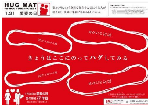
日本愛妻家協会×日比谷花壇 特製ハグマット

足型にあわせて夫婦で立っていただき、夫婦間のコミュニケーションを深めていただく簡易グッズ（紙製マット）です。「愛妻の日」1月31日の午後8時9分に、一斉にハグをしてみることもできます。