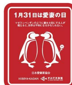
愛妻の日特製ステッカー

開催日：2015年1月31日（土） 配布時間：9時00分～ 配布場所：5F チケット窓口 開催内容：当日入場されるお客さま先着5,000名さまにマゼランペンギンのカップルを描いた「愛妻の日特製ステッカー」をプレゼントします。