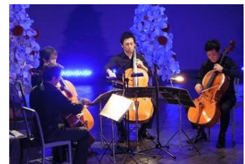
ペンギンと音楽の夜

すみだ水族館では10組以上のペンギンのカップルが、毎日決まった場所を自分たちの「おうち」として生活しています。「ペンギンライブ」では、個性豊かなペンギンたちの恋の話について解説します。