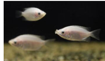
キッシンググラミー

展示内容：発達した唇を動かす動作がキスのように見えるキッシンググラミーを、花を使った綺麗な装飾とともに展示します。