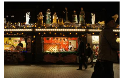
クリスマスマーケットイメージ