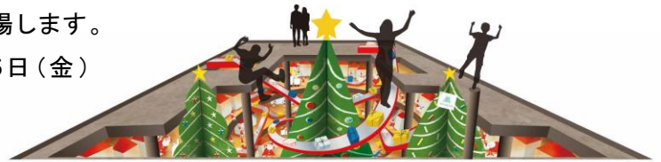
POP UP FANTASY イメージ