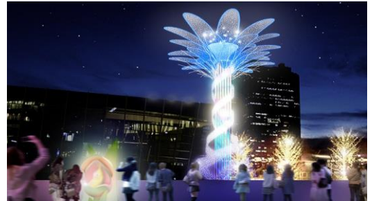
エモーショナル・クリスマスツリーイメージ