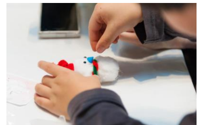
ワークショップ昨年開催時の様子

※ ワークショップ内容によりお時間、料金は異なります。当日のインフォメーションボードにてご確認ください。