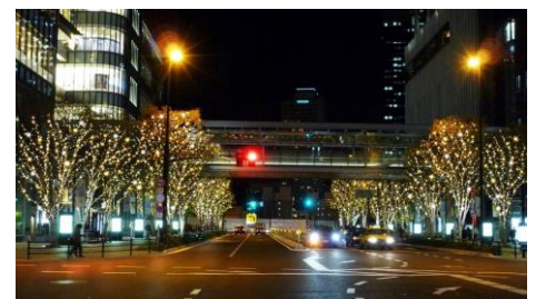
けやき並木イルミネーション 昨年開催時の様子