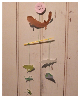
バランスを取りながらゆらゆらと動く『“いのちつながる”いきものモビール』※イメージ