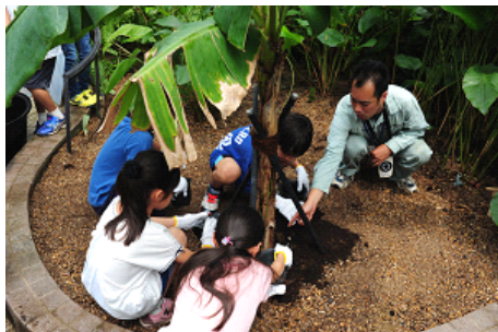
第1回連携ワークショップ 『ゾウさん、オットセイさんのウンチでバナナを育てる』 実施の様子

3園館包括交流連携協定 連携ワークショップでは、これまでに京都市動物園のゾウと京都水族館のオットセイのウンチから肥料ができることや植物に対する肥料の役割について学ぶ『ゾウさん、オットセイさんのウンチでバナナを育てる』や、いきもの全般に関する質問や相談にお答えする『夏休みの宿題いきもの相談会』、「いきものの大きさ」をテーマにした体験学習プログラムを各施設が実施した『いきものスケール』など、3園館が専門性を活かした連携ワークショップを開催しました。