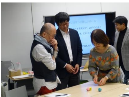
アイデア出しのワークショップ

アイデアを自在に組み立てることが出来る「アイデア理論」のツールを活用し、参加者同士の交流を通じてアイデアを生み出しました。さらに、そのアイデアを具現化する商品企画をナレッジサロン内で募集し全11社24アイテムの中から5アイテムを選出し、その製品が完成しました。