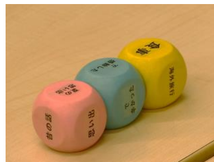
「アイデア理論」のツール