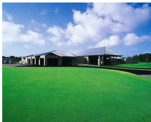
▲ 富士 OGM ゴルフクラブ小野コース (兵庫県小野市)

4月を迎え、いよいよ本格的なゴルフシーズンが到来します。ビジターとして気軽にプレーするのもよいですが、優先的な予約やクラブハンディキャップの取得、競技会への参加などゴルフ場メンバーならではのメリットは少なくありません。OGMでは、期間限定の名義書換料減額キャンペーンや、名義書換料に預託金を充当できるキャンペーン、さらに友人や家族などの知り合い同士と入会する際の割引サービス、女性や39歳以下で入会する際の割引サービスなど、新たにメンバーになっていただくためのさまざまなメニューをご用意しています。また、現在メンバーの方が年齢やライフスタイルなどの変化に伴って、プレー回数や利用する曜日、同伴者やエリアなどプレースタイルが変わり、会員権の利用方法の変更を検討されている方にもキャンペーンをご用意しました。そろそろホームコースを・・・とお考えの方、あるいは現在お持ちの会員権を見直したい・・・とお考えの方は、次ページ以降の【実施中のキャンペーンの概要】をぜひご一読ください。